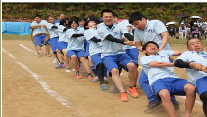
綱引き 1位 3B