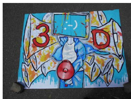
長縄跳び 1位 3C 集団行動 1位 3A 応援旗 1位 3D